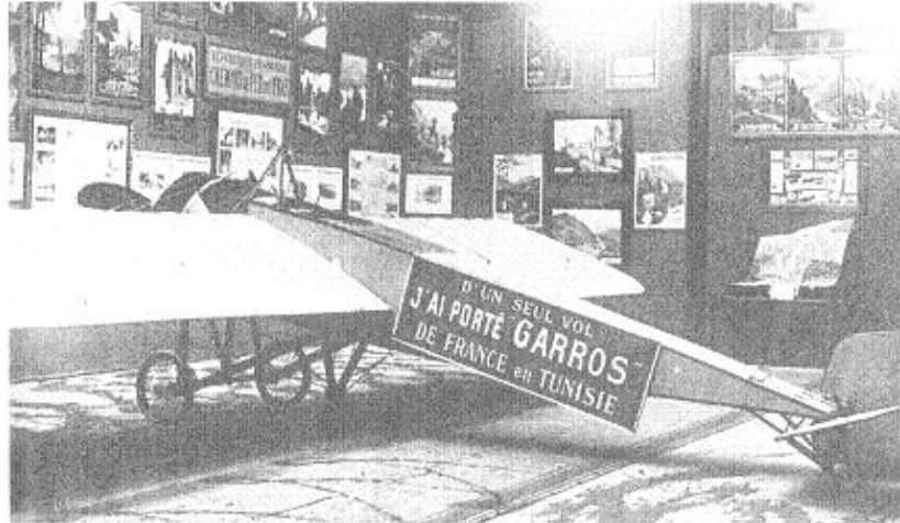
1913 à Paris : Exposition du Morane-Saulnier vainqueur de la Méditerranée (DR)

Roland GARROS, un des plus grands de l'AVIATION