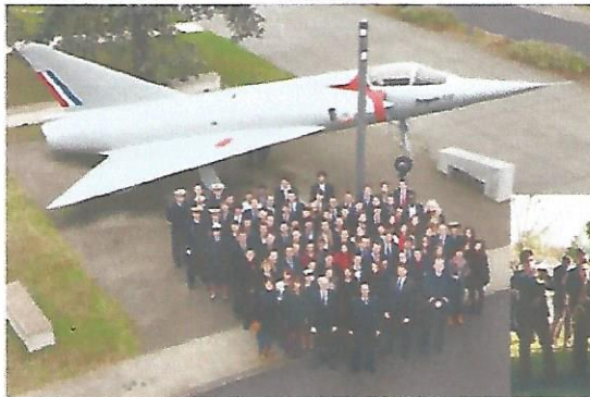
&lt;&lt; Photo de promo ENSICA 2015