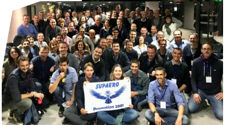
Ils sont venus de partout pour fêter leurs 20 ans de promo... et même de l'Espace avec un petit coup de fil juste avant le dîner de Thomas Pesquet (S2001) en direct depuis l'ISS