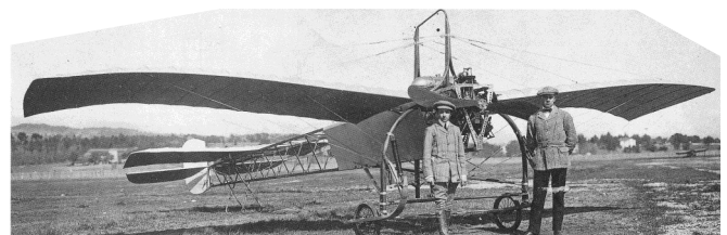
Blinderman-Mayorov [collection Peter M Bowers]

Le site polonais mentionne ensuite l' Ery I à Cannes en juin 1911, où Blinderman et Mayorov l'auraient essayé. Cela est douteux, les pilotes ayant préféré, après le premier meeting aérien dans le sud de la France à l'hippodrome de Mandelieu du 27 mars au 5 avril 1910, utiliser les terrains aménagés de La Brague et Nice-Californie. Ce fut donc probablement un simple survol de cette ville très proche d'Antibes. Lors d'un vol à Nice, il fut endommagé avec "Léon Lecomte" après une chute de 15 m. Puis il fut montré à la 2 ème Exposition sur la navigation aérienne à Moscou, du 25 mars au 8 avril 1912.