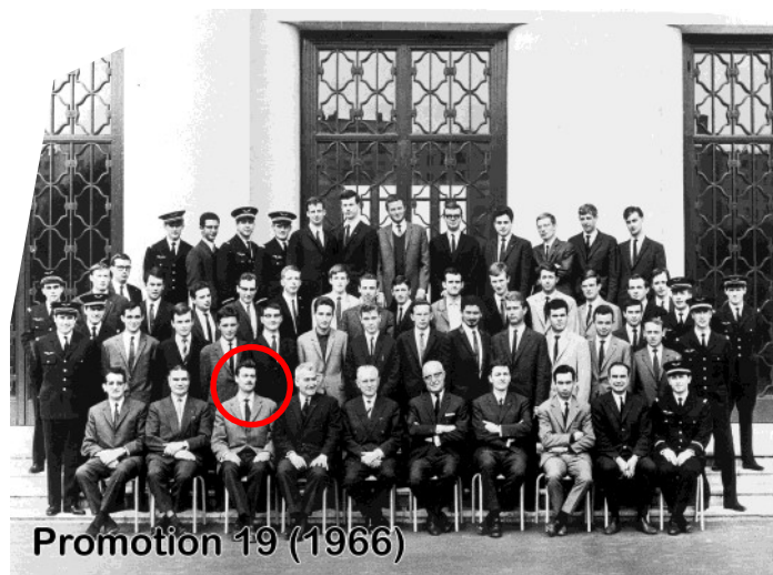
Promotion 19 (1966)

Après une formation complémentaire à Sup'Elec (dont il obtint le diplôme) il trouva sa voie dans l'enseignement au sein du Ministère des Armées et se vit affecté au centre de formation professionnelle de Ville d'Avray.