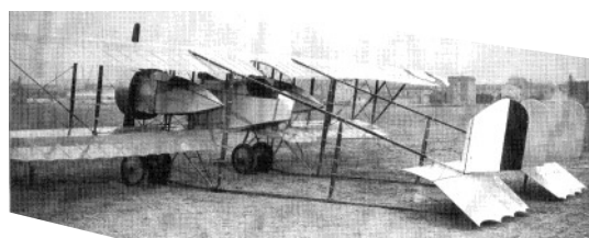
Un Caudron G 4, exporté dans le monde entier