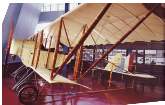
Le mythique Caudron G 3 au Musée de l'Air