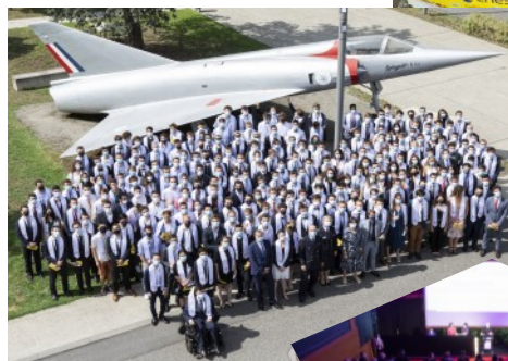
La traditionnelle photo de promo devant le mirage

L'un des trois amphithéâtres où se déroulait la cérémonie